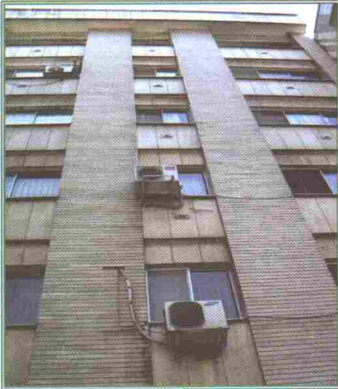
دبیرخانه اتحادیه مالکان کشتی ایران

بالاخر از میدان ولیعصر کوچه رحمتی، شماره ۶ طبقه ۵